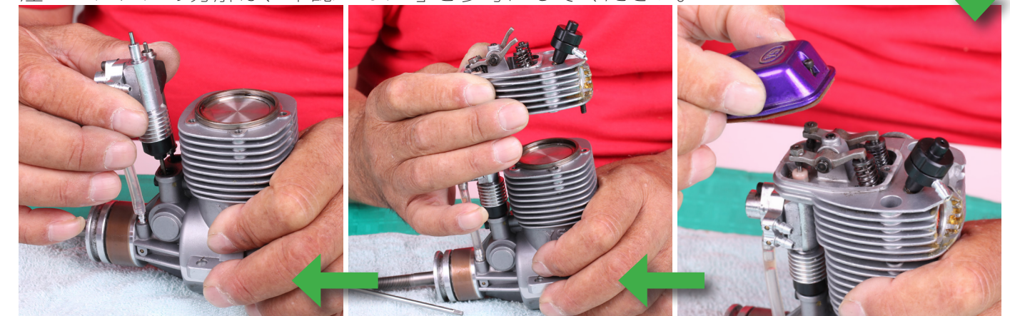
↑プッシュロッドとポンプを外す。